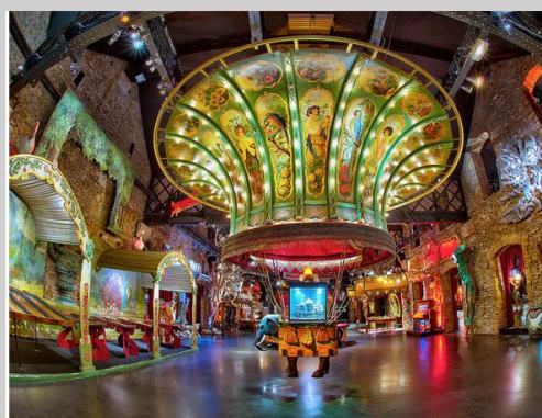
Musée des Arts Forains

53, avenue des terroirs de France 75012 Paris