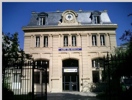
Carrefour des Associations Parisiennes (CAP)

Je vous prie d'agréer, Madame la Présidente, Monsieur le Président, l'expression de mes sentiments distingués.